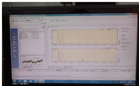
Φωτογραφίες από τον εξοπλισμό του Εργαστηρίου