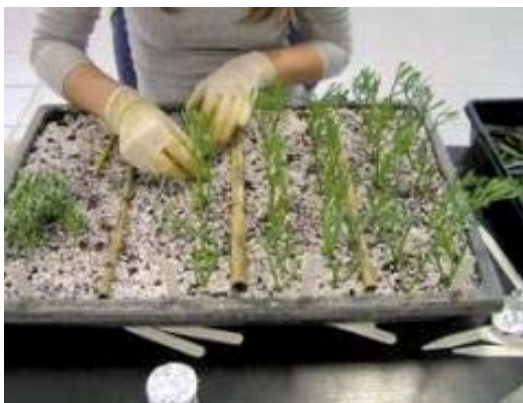
Μοσχεύματα κορυφής Α/Φ φυτών: κρίταμο