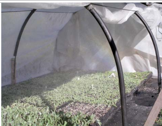
Εγκλιματισμός Α/Φ φυτών στο θερμοκήπιο