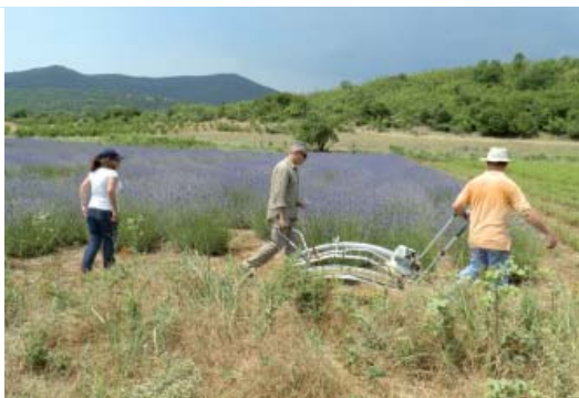
Συλλεκτική μηχανή χειρός κατάλληλη για τη συλλογή πολλών Α/Φ ειδών