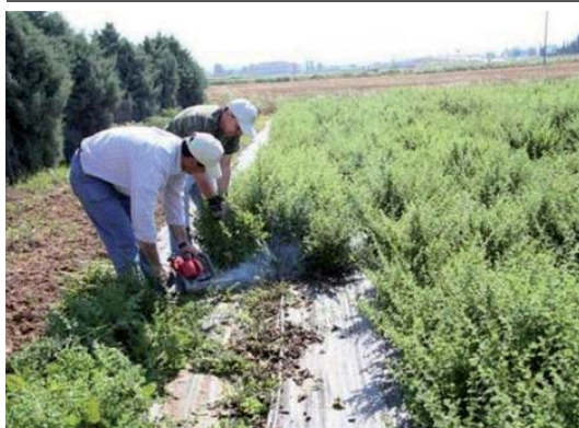
Συλλογή μελισσόχορτου με το χέρι