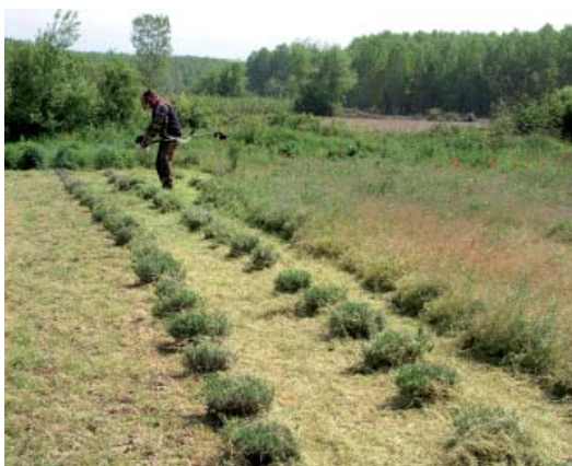
Καταστροφή ζιζανίων σε φυτεία λεβάντας με χορτοκοπτικό μισινέζας