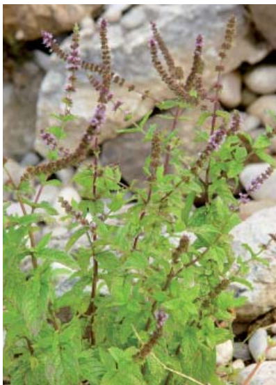
Menta x villosa-nervata (δυόσμος)