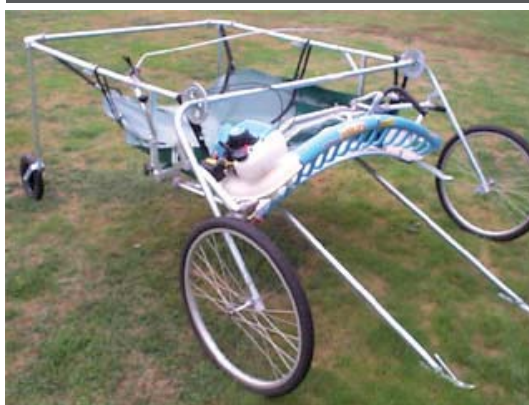
Ελαφριά συλλεκτική μηχανή κατάλληλη για τη συλλογή πολλών Α/Φ ειδών κατασκευής Νέας Ζηλανδίας