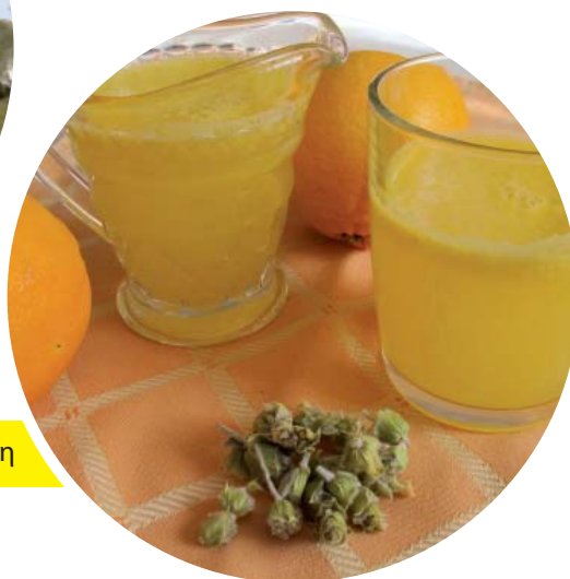
Δροσερός χυμός σιδερίτη