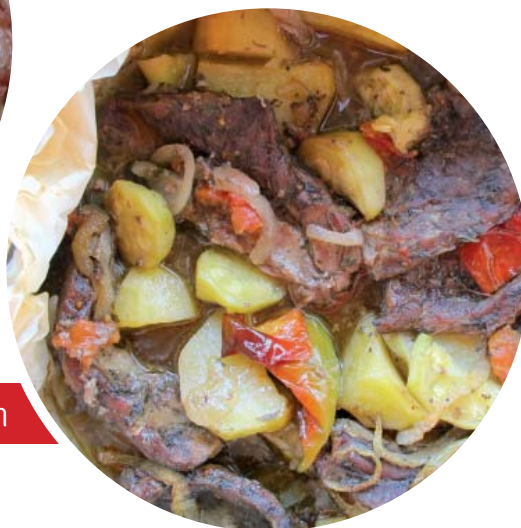
Μοσχάρι με λαχανικά στο λαδόχαρτο, ρίγανη