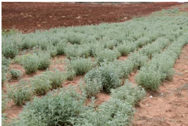
Καλλιέργεια ελληνικού φασκόμηλου Salvia fruticosa