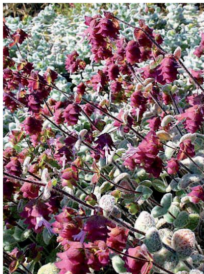
Origanum dictamnus (δίκταμος)