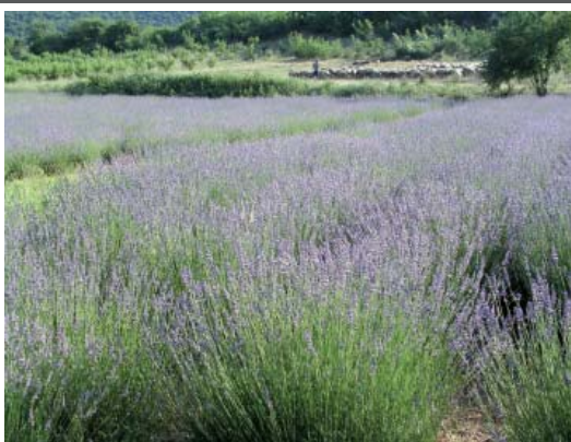
Καλλιέργεια λεβάντας σε άνθιση