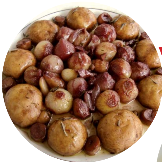
Μανιτάρια στιφάδο, σατουρέγια