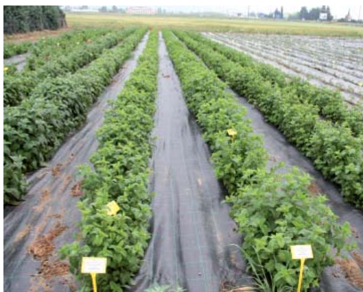
Εδαφοκάλυψη καλλιέργειας μελισσόχορτου με ειδικό πανί για την αποφυγή των ζιζανίων