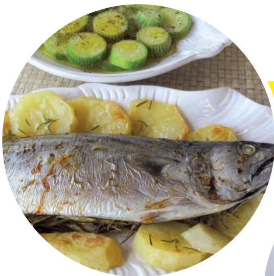
Παλαμίδα με πατάτες, δεντρολίβανο