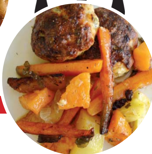
Μπιφτέκια κοτόπουλου, μελισσόχορτο