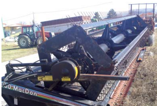
Συλλεκτική μηχανή κατάλληλη για τη συλλογή ρίγανης