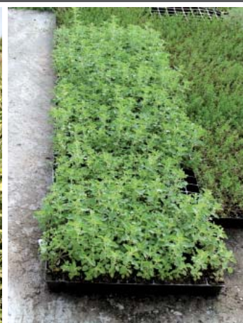
Πολλαπλασιαστικό υλικό ρίγανης