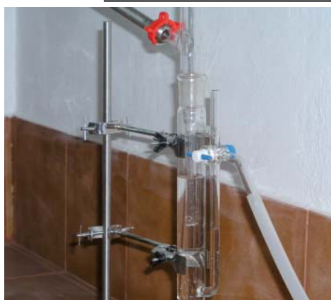
Διαχωριστής αιθέριου ελαίου μικρού βιοτεχνικού αποστακτήρα