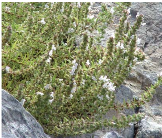
Satureja montana (σατουρέγια, θρούμπι)