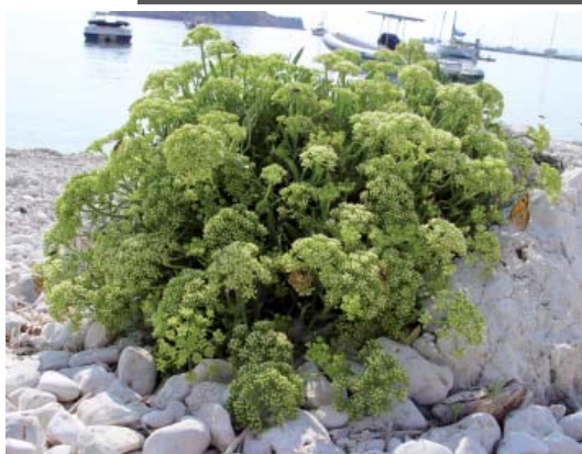
Crithmum maritimum (κρίταμο)