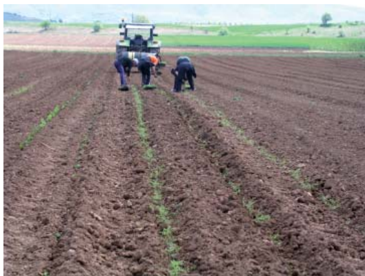
Εγκατάσταση αγροτεμαχίου, φύτευση με το χέρι