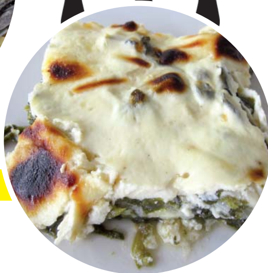
Σπανάκια φούρνου με γιαούρτι μέντα