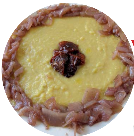
Φάβα Σαντορίνης με κρασάτη σάλτσα, θυμάρι