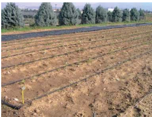
Εγκατάσταση δικτύου άρδευσης με σταγόνες σε αγρό που πρόκειται να καλλιεργηθεί με Α/Φ φυτά