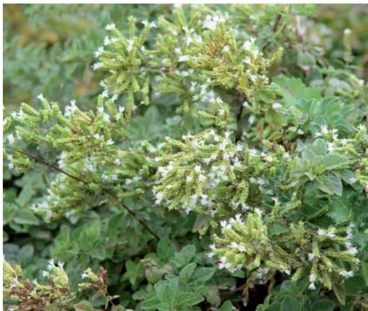
Ανθισμένη ταξιανθία ρίγανης