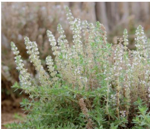
Thymus sibthorpii (θυμάρι του Sibthorp)