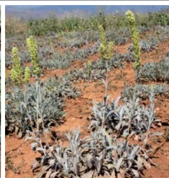
Ταξιανθία (αριστερά) και καλλιέργεια ειδών σιδερίτη