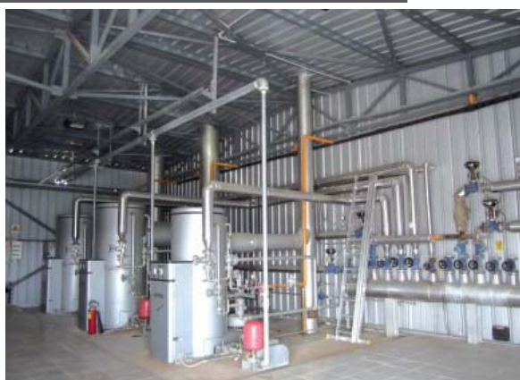
Βιομηχανικοί ατμολέβητες για απόσταξη αιθέριου ελαίου