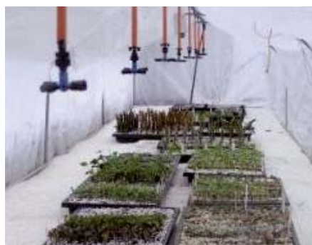
Υδρονέφωση για πολλαπλασιασμό Α/Φ μέσα σε θερμοκήπιο