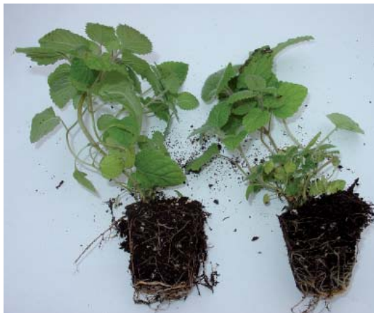
Νεαρά φυτάρια μελισσόχορτου έτοιμα για φύτευση στον αγρό