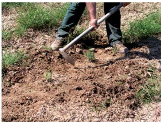
Τσάπισμα νεαρών φυτών λεβάντας