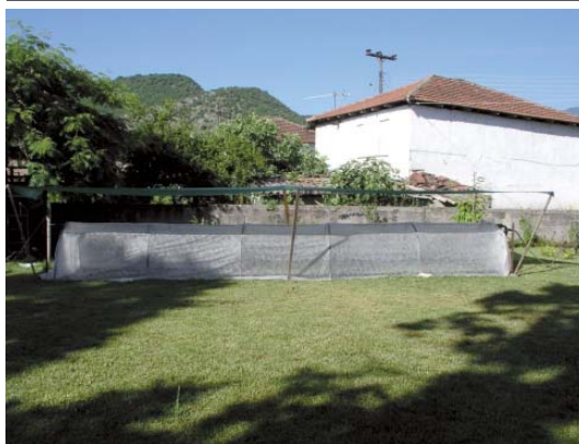
Εξωτερική υδρονέφωση για πολλαπλασιασμό Α/Φ