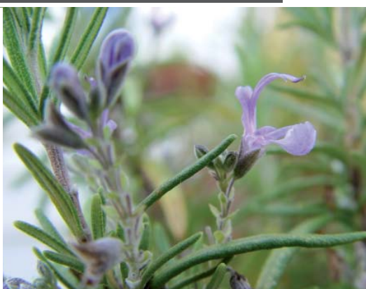
Άνθος Rosmarinus officinalis (δεντρολίβανο)