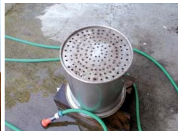
Απόσταξη άνθους λεβάντας σε μικρό βιοτεχνικό αποστακτήρα