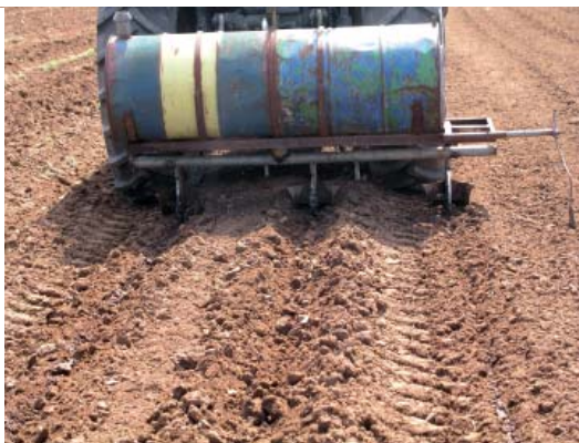
Αυτοσχέδια άρδευση φυταρίων Α/Φ αμέσως μετά τη φύτευση