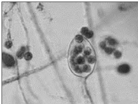
Εικόνα 2. Απελευθέρωση ζωοσπόριων από το ζωοσποριάγγειο.