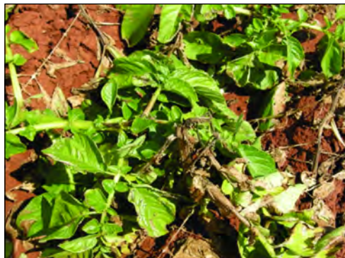
Εικόνα 3. Φυτό πατάτας προσβεβλημένο με περονόσπορο.