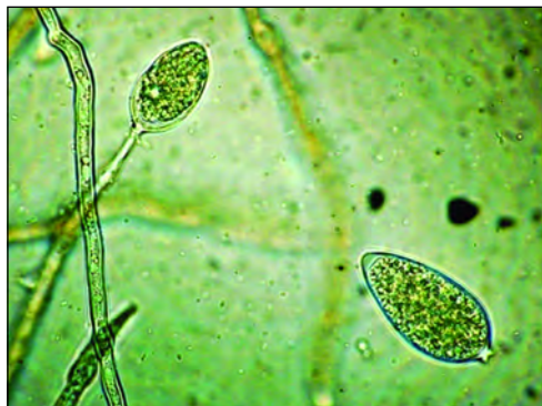
Εικόνα 1. Ζωοσποριάγγεια του Phytophthora infestans .