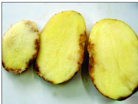
Εικόνα 6. Σκληρή σήψη που αναπτύσσεται στην επιδερμίδα των κονδύλων και επεκτείνεται μερικά χιλιοστά προς τη σάρκα.