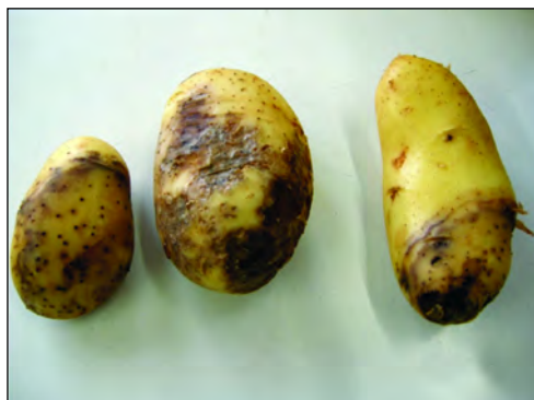
Εικόνα 5. Κόνδυλοι προσβεβλημένοι με περονόσπορο.