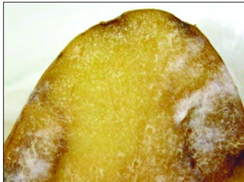
Εικόνα 7. Μυκήθιο του Phytophthora infestans σε επιμήκη τεμαχισμένο κόνδυλο που επώαστηκε σε υγρές συνθήκες για 24 ώρες.