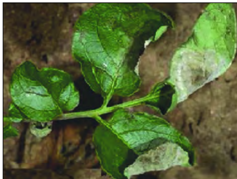
Εικόνα 4. Λευκό μυκήλιο του Phytophthora infestans στην κάτω επιφάνεια προσβεβλημένου φύλλου.