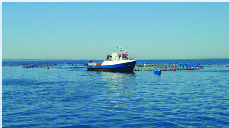
Θαλάσσιες εγκαταστάσεις υδατοκαλλιέργειας Πάχυνση ερυθρού τόνου

Η παραγωγή υδατοκαλλιέργειας αντιπροσωπεύει περίπου το 70% της συνολικής παραγωγής φρέσκων ψαριών στην Κύπρο (αλιείας και υδατοκαλλιέργειας), σε όγκο και αξία. Με το ποσοστό αυτό, η Κύπρος βρίσκεται στις πρώτες θέσεις μεταξύ των Κρατών της ΕΕ από απόψεως οικονομικής σημασίας της υδατοκαλλιέργειας, σε σχέση με την ολική παραγωγή αλιευτικών προϊόντων.