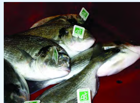
Σήμανση ποιότητας ψάρια υδατοκαλλιέργειας

Η προώθηση των προϊόντων με στόχο την εύρεση νέων αγορών μπορεί να γίνει α) μέσω εκστρατειών, οι οποίες θα αφορούν την προβολή των προϊόντων με έμφαση στις υγιεινές ιδιότητες της διατροφής με ψάρια, τη