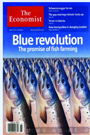
Εξώφυλλο περιοδικού «The Economist»

Η συνολική παραγωγή των υδατοκαλλιεργειών (θαλάσσιων και γλυκού νερού) το 2008 ανήλθε περίπου στους 3800 τόνους ψαριών και 13,5 εκ. ιχθύδια τσιπούρας και λαβρακιού, συνολικής αξίας περίπου €35 εκατ. Κατά τη διάρκεια του 2008, η Κύπρος εξήγαγε περίπου 2500 τόνους ψάρια υδατοκαλλιέργειας αξίας €27 εκατ. Σημαντική συμβολή είχε η διαφοροποίηση της παραγωγής με νέα είδη ψαριών και ειδικότερα της καλλιέργειας/πάχυνσης ερυθρού τόνου, η οποία αντιπροσωπεύει περίπου το 70% των εξαγωγών σε αξία και το 40% σε όγκο. Η αύξηση των εξαγωγών των προϊόντων υδατοκαλλιέργειας καθιστά την κυπριακή υδατοκαλλιέργεια πιο ανταγωνιστική μετά και τη φιλελευθεροποίηση της αγοράς και επιτεύχθηκε σε μια δύσκολη περίοδο για τον ευρύτερο γεωργικό τομέα.