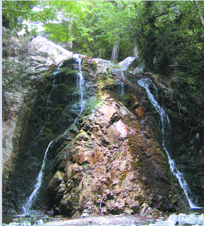
Καταρράκτης Χαντάρας Chantara falls