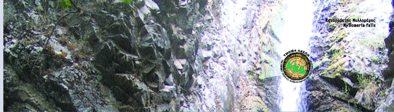
Καταρράκτης Μυλλομέρης Mylomeris falls