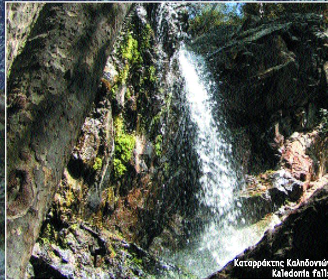
Καταρράκτης Καληδονιών Kaledonia falls