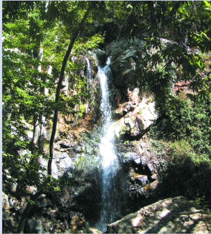
Καταρράκτης Καληδονιών Kaledonia falls