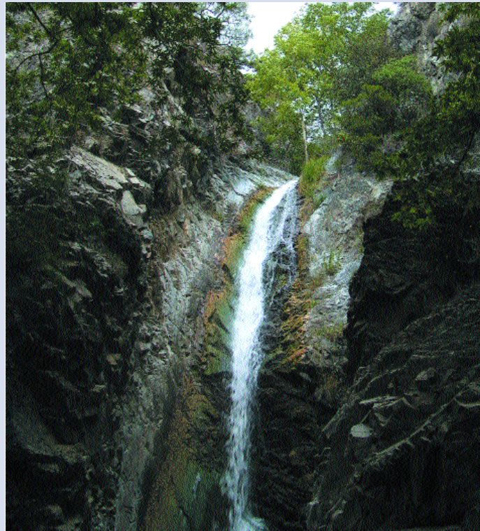
Καταρράκτης Μυλλομέρη Mylomeris falls