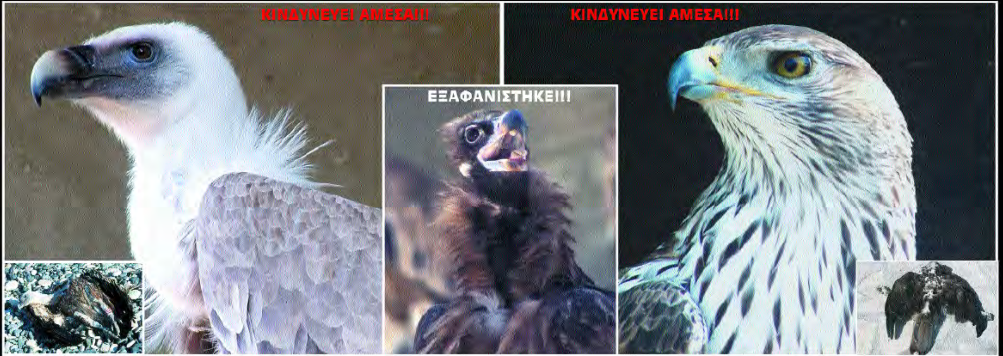
Γύπας - Gyps fulvus - Griffon vulture

ΤΑ ΔΗΛΗΤΗΡΙΑΣΜΕΝΑ ΔΟΛΩΜΑΤΑ ΟΔΗΓΗΣΑΝ ΠΟΛΛΑ ΕΙΔΗ ΤΗΣ ΑΓΡΙΑΣ ΖΩΗΣ ΤΟΥ ΤΟΠΟΥ ΜΑΣ ΣΤΟ ΧΕΙΛΟΣ ΤΗΣ ΕΞΑΦΑΝΙΣΗΣ