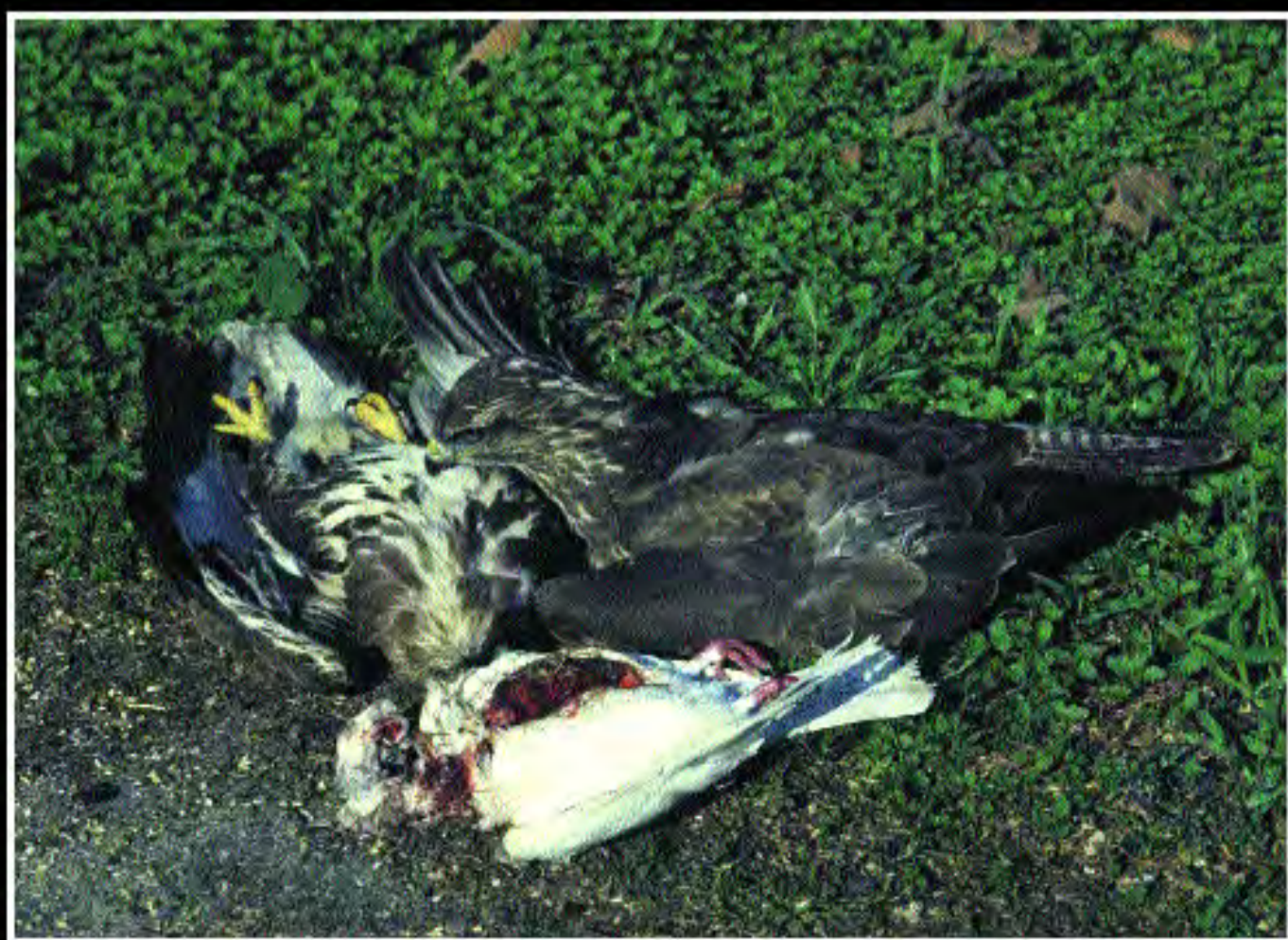
Δηλητηριασμένα αρπακτικά πουλιά Poisoned birds of prey

Η ΧΡΗΣΗ ΔΗΛΗΤΗΡΙΑΣΜΕΝΩΝ ΔΟΛΩΜΑΤΩΝ ΕΧΕΙ ΑΠΑΓΟΡΕΥΤΕΙ ΣΤΗΝ ΚΥΠΡΟ ΑΠΟ ΤΟ 1993. ΩΣΤΟΣΟ ΤΟ ΦΑΙΝΟΜΕΝΟ ΑΥΤΟ ΔΥΣΤΥΧΩΣ ΑΚΟΜΑ ΥΠΑΡΧΕΙ.