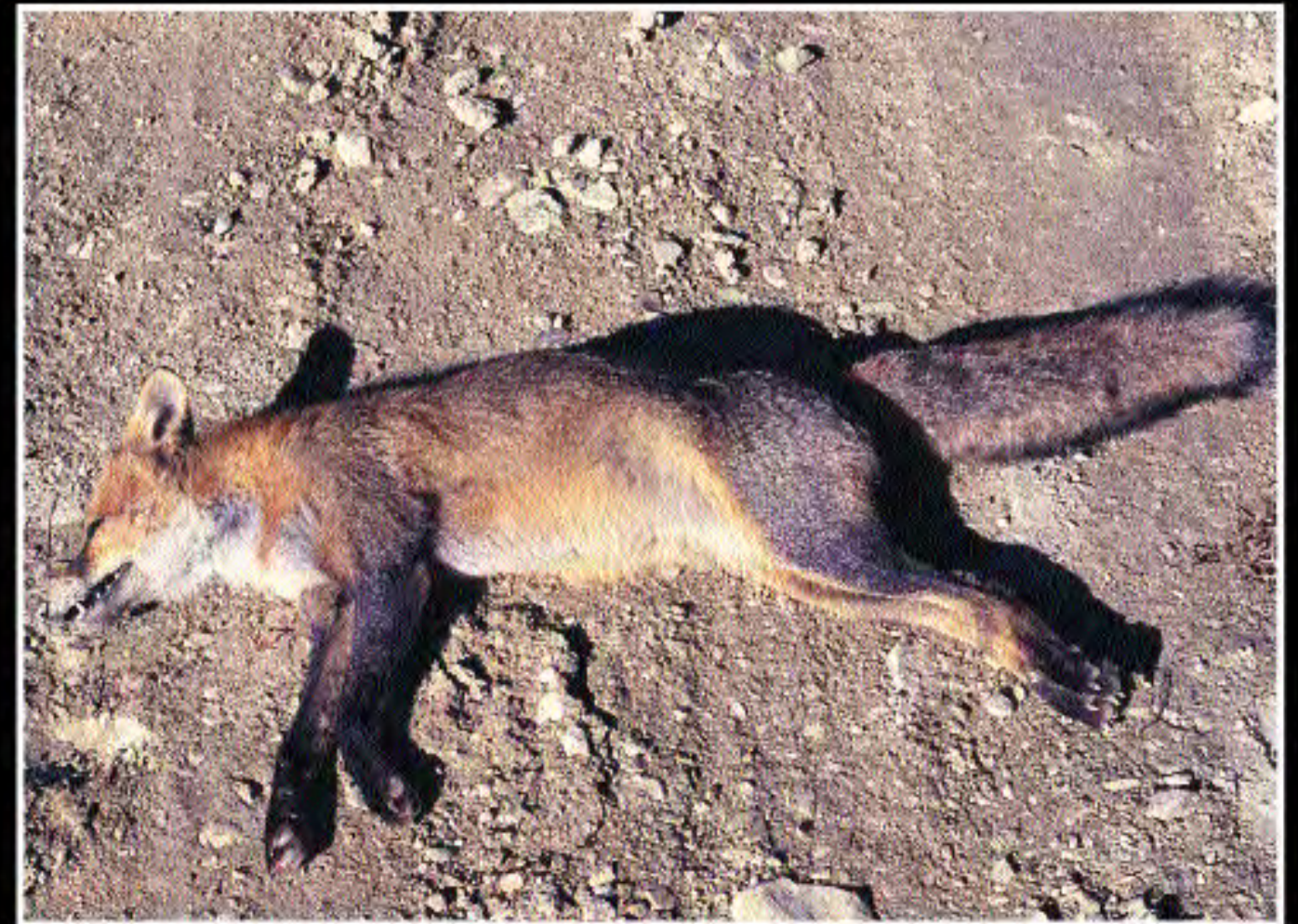
Δηλητηριασμένη αλεπού - Poisoned fox - ( Vulpes vulpes indutus , Red Fox)

ΧΡΗΣΙΜΟΠΟΙΩΝΤΑΣ ΔΗΛΗΤΗΡΙΑΣΜΕΝΑ ΔΟΛΩΜΑΤΑ ΩΣ ΤΗΝ ΕΥΚΟΛΗ ΛΥΣΗ ΓΙΝΕΣΤΕ ΣΥΝΕΡΓΟΙ ΣΤΗΝ ΕΞΑΦΑΝΙΣΗ ΣΠΑΝΙΩΝ ΕΙΔΩΝ ΤΗΣ ΑΓΡΙΑΣ ΖΩΗΣ ΤΟΥ ΤΟΠΟΥ ΜΑΣ ΕΠΗΡΕΑΖΟΝΤΑΣ ΑΡΝΗΤΙΚΑ ΤΗ ΒΙΟΠΟΙΚΙΛΟΤΗΤΑ ΚΑΙ ΤΗΝ ΑΝΘΡΩΠΙΝΗ ΥΓΕΙΑ