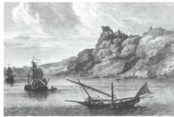
Scenes sur mer de Santorini, avec une maison Comte de Chastel-Goubler, Vierge primitive de la Cité. Éphère 1782. (Collection I. M. Andrieu)