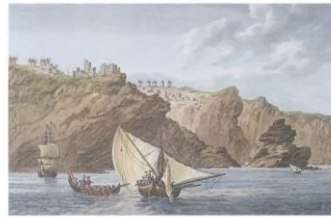
In Santorini 1782

Oia is mentioned by many travellers Long before 1650; during the years of Frankish rule in Greece and the Aegean Sea in particular, Oia was one of the 5 castle-towns (called "castellia") of Santorini, i.e. capital of one of the 5 administrative units into which Santorini was divided then.