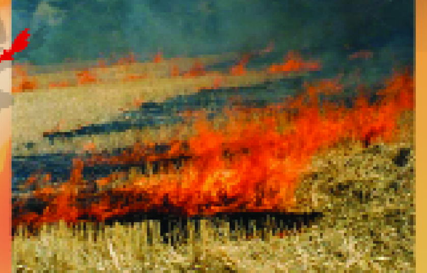
Κάψιμο αποκαθήμης, κλαδιών και άλλων ξηρών χόρτων