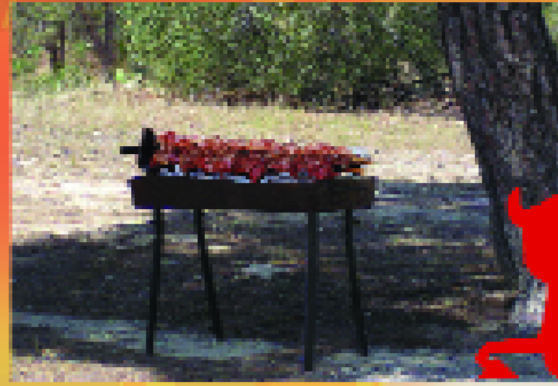
Ετοιμασία φαγητού στο δάσος εκτός των προκαθορισμένων χώρων

Μην αφήσεις τον κακό δαίμονα της φωτιάς να καταστρέψει το δάσος