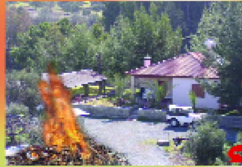
Δραστηριότητες σε κατοικίες