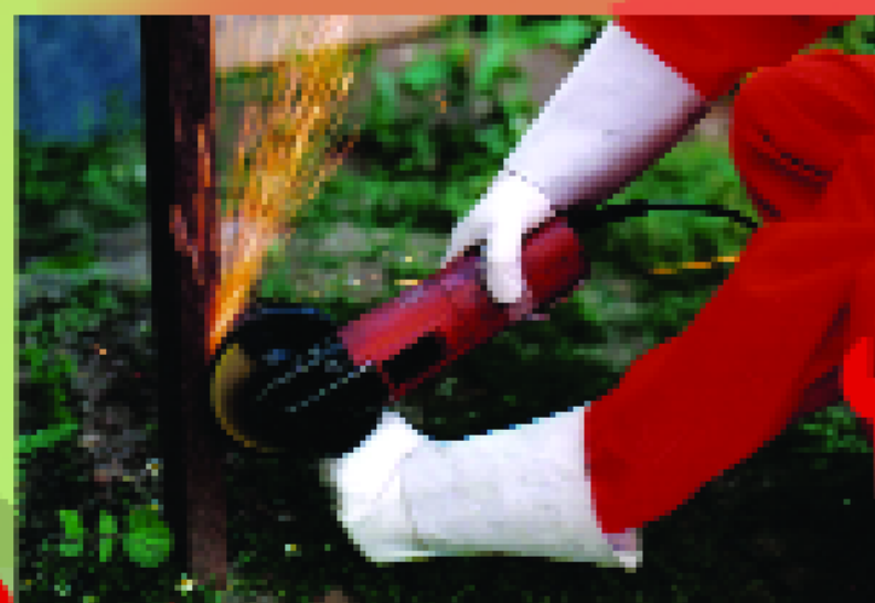
Χρήση ηλεκτρικών εργαλείων

Προστάτεψε το Δάσος... Προστάτεψε τη Ζωή σου