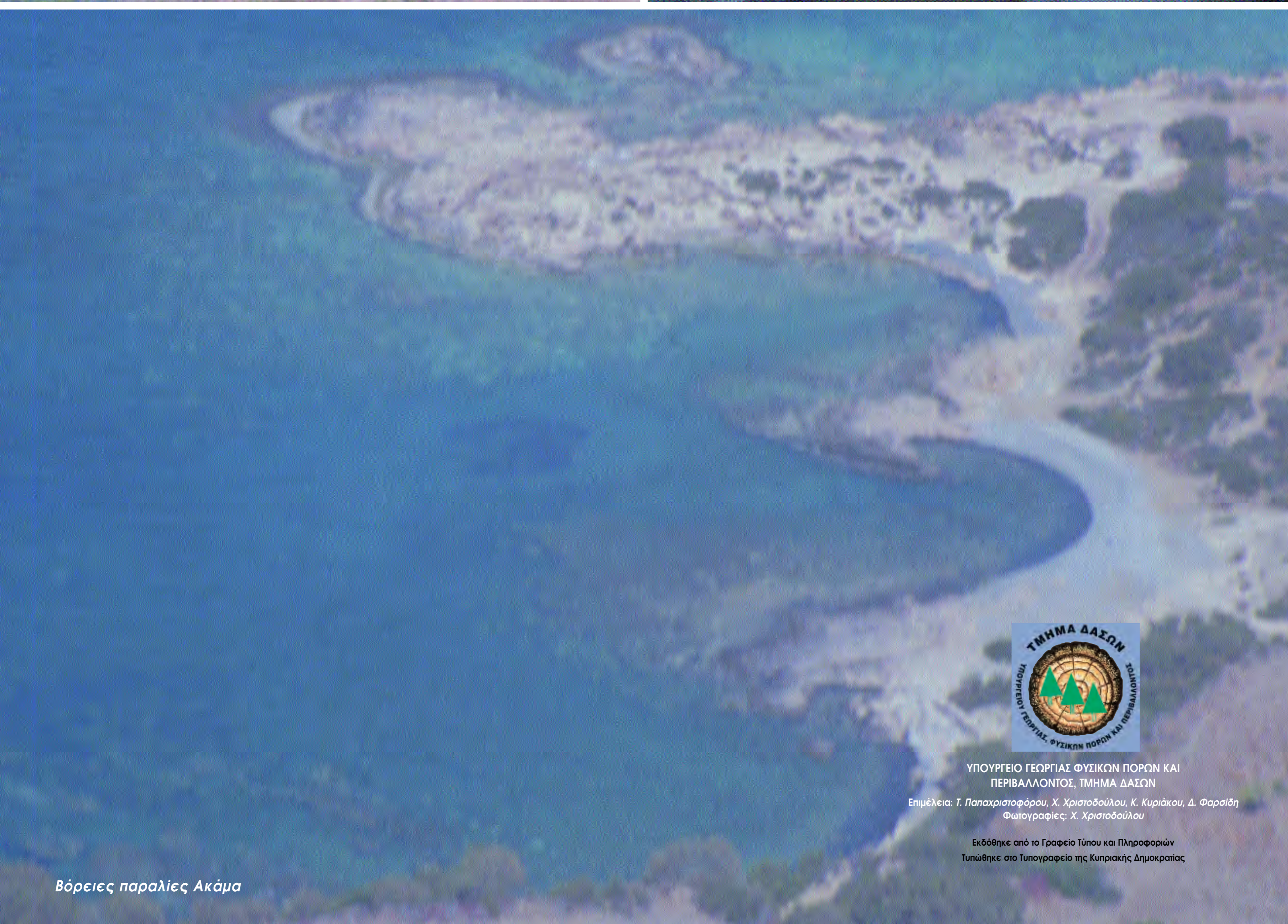
Βόρειες παραλίες Ακάμα