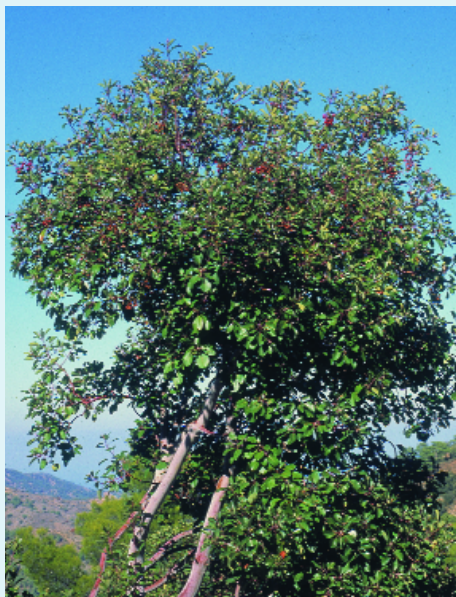
Αντροκλιά σε θαμνώδη μορφή

ενδημικά είδη πεύκης της Μεσογείου, τα δάση του κυπαρισσιού, οι θαμνώνες και οι δασικές συστάδες της λατζιάς, οι δασικές συστάδες της δρυός και τα ενδημικά δάση της Μεσογείου με άρκευθους. Το μεγαλύτερο ποσοστό των υπό αναφορά οικοτόπων έχει συμπεριληφθεί στο ευρωπαϊκό δίκτυο προστατευόμενων Natura 2000 . Με τον τρόπο αυτό διασφαλίζεται μόνιμα και η προστασία της αντροκλιάς. Πέραν από τη νομική προστασία, η αντροκλιά έχει την ικανότητα να πρεμνοβλαστώνει μετά από πυρκαγιά ή υλοτομία και έτσι αντέχει σε αυτές τις δυσμενείς επιδράσεις.