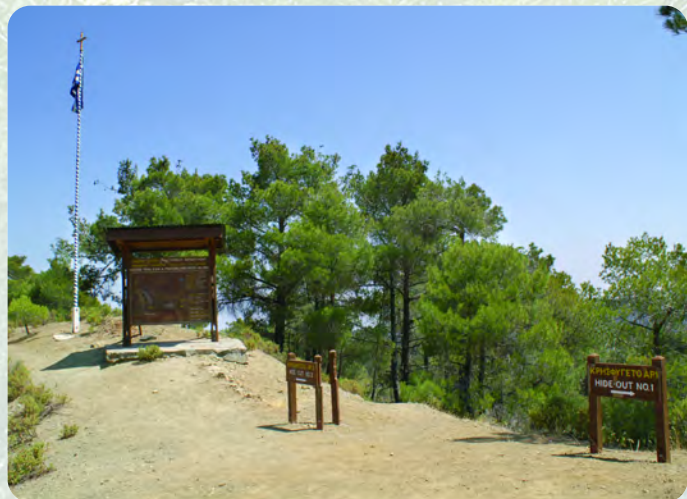
Κεντρικό σημείο του χώρου των κρησφυγέτων