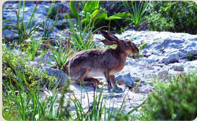
Λαγός ( Lepus europaeus cyprius )

( Columba palumbus ), το Σιακί ( Falco tinnunculus ) το Διπλοσιάχινο ( Accipiter gentilis ) η Σκαλιφούρτα ( Oenanthe cybriaca ) και η Κίσσα ( Garrulus glandarius ).