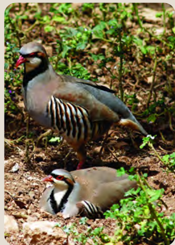
Πέρδικα ( Alectoris chukar )