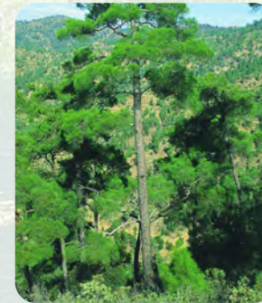
Τραχεία πεύκη ( Pinus brutia )