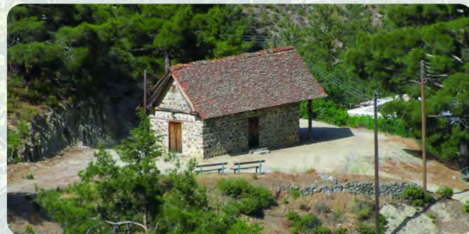
Εκκλησία Τιμίου Σταυρού