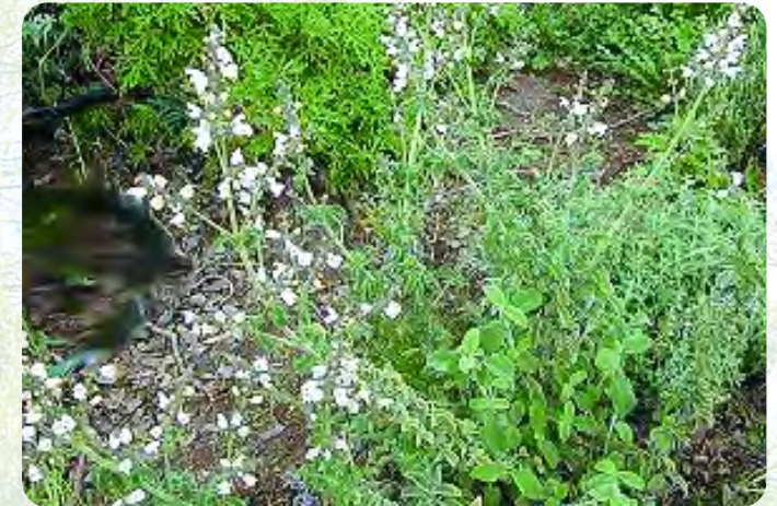
Σπατζιά ( Salvia fruticosa )

Αρκοκουσιά ( Astragalus lusitanicus ), Πετρόχορτο ( Sedum sediforme ), Τρανίδι ( Rubia tenuifolia ), Κόνυζος ( Inula viscosa ), Σκουτελλάρια ( Scutellaria cypria ), Αιγιόκλημα ( Lonicera etrusca ), Σφένδαμνος ( Acer obtusifolium ), Τεύκριον ( Teucrium cyprium ), Ανελιφικιά ( Hybarrhenia hirta ), Κλάματα της Παναγίας ( Arabis purpurea ), Σπουρτούλλα ( Asphodelus aestivus ), Αμυγδαλιά ( Prunus dulcis ) κλπ.