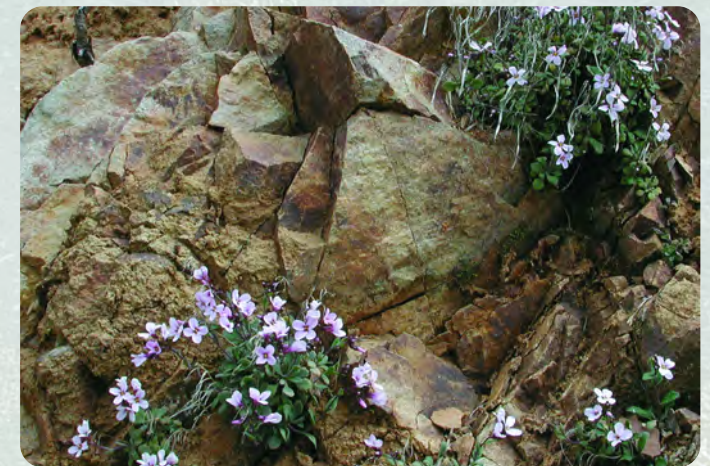
Κλάματα της Παναγίας ( Arabis purpurea )

Αρκοκουσιά ( Astragalus lusitanicus ), Πετρόχορτο ( Sedum sediforme ), Τρανίδι ( Rubia tenuifolia ), Κόνυζος ( Inula viscosa ), Σκουτελλάρια ( Scutellaria cypria ), Αιγιόκλημα ( Lonicera etrusca ), Σφένδαμνος ( Acer obtusifolium ), Τεύκριον ( Teucrium cyprium ), Ανελιφικιά ( Hybarrhenia hirta ), Κλάματα της Παναγίας ( Arabis purpurea ), Σπουρτούλλα ( Asphodelus aestivus ), Αμυγδαλιά ( Prunus dulcis ) κλπ.