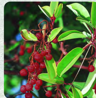
Αντροκλιά ( Arbutus andrachne )

Στην πορεία προς τα Λημέρια ο πεζοπόρος μπορεί να συναντήσει εκτός από την Τραχεία πεύκη ( Pinus brutia ) και τη Λατζιά ( Quercus alnifolia ), τα πιο κάτω είδη: Αντροκλιά ( Arbutus andrachne ), Τρεμιθιά ( Pistacia terebinthus ), Μοσφιλιά ( Crataegus azarolus ), Ρούδι ( Rhus coriaria ), Ξυσταρκά ( Cistus creticus και Cistus salvifolius ), Σπατζιά ( Salvia fruticosa ), Θυμάρι ( Thymus integer ), Ψυλλίνα ( Helichrysum conglomeratum ), Πτεροκέφαλο ( Pteroccephalus multiflorus ), Πιφάνης ή