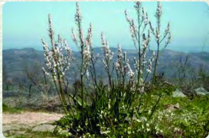
Σπουρτούλλα ( Asphodelus aestivus )

Η έκταση που καλύπτει το Μονοπάτι βρίσκεται μέσα στην περιοχή ΦΥΣΗ 2000 «Μαδαρή- Παπούτσα».