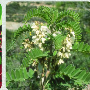
Πιφάνης ( Astragalus lusitanicus )