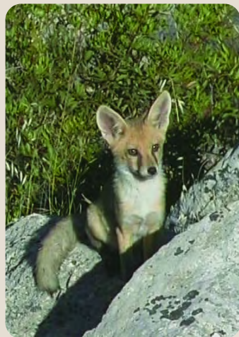
Αλεπού ( Vulpes vulpes )

Πρόσβαση στα Λημέρια μπορεί να γίνει και με αυτοκίνητο διά μέσου δασικού δρόμου από το χωριό Σπήλια, από την τοποθεσία Μούττη της Χώρας και από το χωριό Κούρδαλι διά μέσου δασικού μονοπατιού.