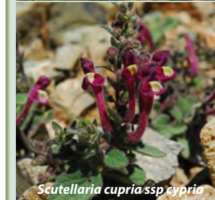
Scutellaria cupria ssp cypria