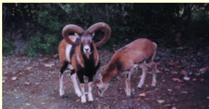
Το κυπριακό αγρινό ( Ovis gmelini ophion )

Ιστορικές μαρτυρίες (μωσαϊκά, κείμενα) αναφέρουν ότι το κυνήγι του αγρινού ήταν πολύ διαδεδομένο μέχρι τον προηγούμενο αιώνα και γίνονταν με σκύλους ή κυναιήθους. Λόγω του κινδύνου εξαφάνισής του, το κυνήγι του έχει απαγορευτεί και το κυπριακό αγρινό είναι προστατευόμενο είδος. Σήμερα υπολογίζεται ότι υπάρχουν πέραν των 2.000 ζώων στο δάσος Πάφου.