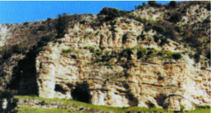
Γεωλογικός Σχηματισμός (από ασβεστολιθικά πετρώματα)

Το δάσος Πάφου έχει κηρυχθεί σε Μόνιμη Περιοχή Προστασίας Κυνηγίου και αποτελεί τέλειο καταφύγιο για την άγρια ζωή από το 1938. Το κυπριακό αγρινό ( Ovis gmelini orphion ), το μεγαλύτερο ενδημικό θηλαστικό της Κύπρου, ζει και αναπαράγεται σε ιδιαίτερους βιότοπους του δάσους. Η παρουσία της αλεπούς ( Vulpes vulpes indutus ), του λαγού ( Lepus europaeus cyprius ), του σκαντζόχοιρου ( Hemiechinus auritus ssp. dorotheae ) και αρκετών σημαντικών ειδών πουλιών όπως οι σπάνιοι και προστατευόμενοι αετοί ( Aquila heliaca , Hieraaetus fasciatus ), ο γύπας ( Gyps fulvus ), το ανδόνι ( Luscinia megarhynchos ), το ανθρωποπούλι ( Tyto alba ), το θουπί ( Otus scops cyprius ), αρκετά είδη κουκουβάγιων, η πέρδικα ( Alectoris chukar ), η φάσσα ( Columba palumbus ) και το τρυγόνι ( Streptopelia turtur ) μαζί με διάφορα είδη φιδιών και σαυρών, κοίλοπτέρων και σπάνιων πεταλιούδων συνθέτουν μια πλούσια πανίδα μεγάλης οικολογικής σημασίας για τον τόπο.