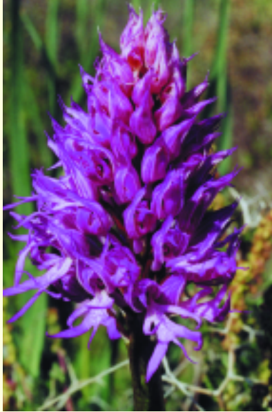
Orchis italica Ορχιδέα

Τα είδη των φυτών που απαντώνται στο δάσος Πάφου υπολογίζεται ότι ξεπερνούν τα 600. Ανάμεσα τους πενήντα (50) ενδημικά της Κύπρου από τα οποία 4 συμπεριλαμβάνονται στη Σύμβαση της Βέρνης και 11 στον κατάλογο της Διεθνούς Ένωσης για Διατήρηση του Περιβάλλοντος (I.U.C.N.). Η ύπαρξη μεγάλου αριθμού orchιδέων όπως το Limodorum abortivum , η Orchis sancta , η Ophrys