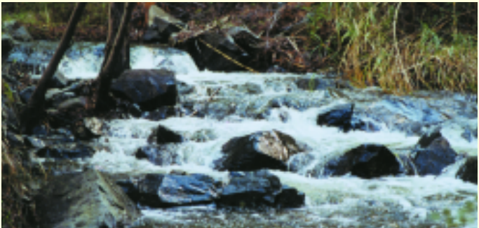
Ποταμός του Πλωμού

Το υδρογραφικό δίκτυο του δάσους Πάφου είναι αποτέλεσμα της κατανομής της βροχόπτωσης, των γεωμορφολογικών συνθηκών και των πετρωμάτων που υπάρχουν. Μπορεί να χαρακτηριστεί σαν ακτινωτό με τους ποταμούς να κατευθύνονται από την ψηλότερη κορυφή, τον Τρίπηλο, προς την περιφέρεια του δάσους. Οι σημαντικότεροι ποταμοί είναι ο Διαρίζος, ο Ρούδιας, της Αγιάς, του Σταυρού της Ψώκας, του Αγίου Μερκουρίου, της Φλέγιας, του Λιμνίτη και του Ξερού. Ο Διαρίζος μαζί με το Ρούδια έχουν όλο το χρόνο νερό και αποτελούν την κύρια πηγή εμπλοτισμού των υπόγειων υδροφόρων στρωμάτων των κοιλάδων που διασχίζουν. Η ύπαρξη πλούσιων υδροφόρων στρωμάτων προσδίδει στο δάσος Πάφου μεγάλη υδρολογική αξία. Ένας σημαντικός αριθμός πηγών υδροδοτούν 47 παραδασόβια χωριά. Τα κύρια υδατικά