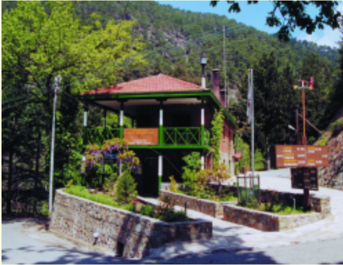
Κεντρικά Γραφεία Δασικής Περιφέρειας Πάφου στο Σταυρό της Ψώκας

Η διοίκηση και διαχείριση του δάσους είναι αρμοδιότητα του Τμήματος Δασών του Υπουργείου Γεωργίας, Φυσικών Πόρων και Περιβάλλοντος. Στο δασικό σταθμό Σταυρού της Ψώκας βρίσκεται η κεντρική διοίκηση του δάσους. Δασικοί σταθμοί υπάρχουν στα χωριά Κάμπος, Παναγιά, Γιαλιά, Άγιος Νικόλαος, Γεροσκήπου, Λυσός, Κάτω Πύργος και στα νέα κυβερνητικά κτήρια Πάφου. Για αποτελεσματική διοίκηση και διαχείριση των δασικών πόρων το δάσος Πάφου χωρίζεται σε έντεκα (11) κοιλάδες· οι κοιλάδες Διαρίζου (Πηλατός), Ρούδια, Αγιάς, Σταυρού της Ψώκας, Αγίου Μερκουρίου, Γιαλιάς, Λειβαδίου, Φλέγιας, Λιμνίτη, Κάμπου και Ξερού. Οι κύριες δασικές δραστηριότητες είναι η προστασία του δάσους από τις πυρκαγιές, η σχεδίαση, βελτίωση και συντήρηση εκδρομικών και κατασκηνωτικών χώρων, μονοπατιών μελέτης της φύσης και του δασικού οδικού δικτύου, η διαχείριση και περιποίηση των δασικών συστάδων και δασικών βιοτόπων ή αναδάσωση γυμνών εκτάσεων, η παραγωγή δασικών δενδρυλλίων, ο σχεδιασμός, η φύτευση και περιποίηση δεντροστοιχιών και χώρων πρασίνου, η διατήρηση και προστασία της άγριας ζωής κ.λ.π.