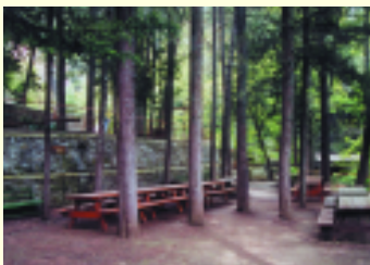
Εκδρομικός χώρος Σταυρού της Ψώκας

Ο επισκέπτης του δάσους Πάφου έχει την ευκαιρία να απολαύσει και να θαυμάσει τις φυσικές και ανεπανάληπτες ομορφιές των δασικών οικοσυστημάτων, να αναζωογονηθεί και ηρεμήσει στο ιδιαίτερο ενδοδασικό περιβάλλον, να μελετήσει, να εμπνευστεί και να ασκηθεί ακολουθώντας τα μονοπάτια της φύσης, να διασκεδάσει και να απολαύσει το φαγητό του, να ξεφύγει από τη μονοτονία και ένταση της καθημερινής ζωής και να βρεθεί στο απόλυτα καθαρό περιβάλλον απαλλαγμένο από κάθε ρύπανση. Η επαφή του επισκέπτη με τα στοιχεία του δάσους θα χαρίσει σ' αυτόν αξέχαστες εμπειρίες. Οι επισκέπτες του δάσους Πάφου αυξάνονται από χρόνο σε χρόνο, γι' αυτό το Τμήμα Δασών, σε συνεργασία και με άλλες Υπηρεσίες, έχει προχωρήσει στην κατασκευή και συνεχίζει να κατασκευάζει αριθμό εκδρομικών και κατασκηνωτικών χώρων και μονοπατιών μελέτης της φύσης. Η ύπαρξη ξενώνα και μικρού εστιατορίου στο Σταυρό της Ψώκας εξυπηρετούν τους επισκέπτες που θέλουν να διανυκτερεύσουν και να απολαύσουν τις φυσικές ομορφιές του δάσους.