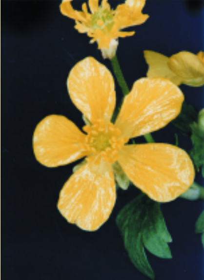
Ranunculus kykkoensis Ρανούγκουλας του Κύκκου

levantina και Serapias vomeracea και ειδών που συναντούνται μόνο στο δάσος Πάφου όπως το Origanum cordifolium , το Ranunculus kykkoensis , το Onosma mitis , το Erysimum kykkoticum και το Arum tupicola καθιστούν το δάσος Πάφου σημαντικό βιότοπο της χλωρίδας στη Μεσόγειο.