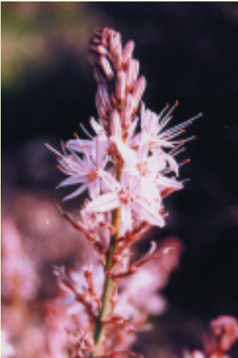
Asphodelus aestivus Ασφόδελος ο θερινός