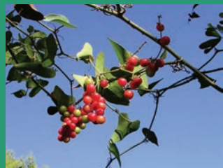
Smilax aspera -Αντζουλόβωτος