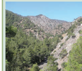
Pinus brutia -Τραχεία Πεύκη

Η αφετηρία του μονοπατιού βρίσκεται σε σημείο πάνω στον δρόμο Αμιάντου - Κατασκήνωσης ΣΕΚ . Ερχόμενοι από τον δρόμο Καρβουνά προς Σαϊτά η διαδρομή περνά μέσα από την κοινότητα Αμιάντος . Μετά το γεφύρι στρίψτε δεξιά για τις κατασκηνώσεις ΣΕΚ. Στον δρόμο αυτό θα βρείτε την αφετηρία και το χαρακτηριστικό κιόσκι με πληροφορίες. Σήμανση για το μονοπάτι θα συναντήσετε στον κύριο δρόμο Καρβουνά - Αμιάντου και στον δευτερεύοντα δρόμο μέσα στο χωριό. Μπορείτε να πάτε εκεί με το ιδιωτικό σας όχημα σταθμευοντάς το στον χώρο στην αφετηρία. Τις καθημερινές μπορείτε, επίσης, να χρησιμοποιήσετε τα λεωφορεία της ΕΜΕΛ από και προς τη Λεμεσό (δρομολόγιο 64). Σχετικές λεπτομέρειες είναι διαθέσιμες στον σύνδεσμο http://www.limassolbuses.com/rural-routes . Από και προς τη Λευκωσία μπορείτε να χρησιμοποιήσετε τα δρομολόγια της ΟΣΕΛ (δρομολόγιο ΒΔ39). Σχετικές λεπτομέρειες υπάρχουν στον σύνδεσμο http://www.osel.com.cy .