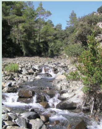
Μονοπάτι Λούματα των Αετών

Η πορεία διασχίζει μια πανέμορφη πλαγιά με πυκνό δάσος, καταλήγοντας στον ποταμό Λούματα των Αετών ο οποίος έχει σημαντική ροή, ακόμη και το καλοκαίρι. Από εκεί, ακολουθεί πορεία κατά μήκος της κοίτης του ποταμού και τελειώνει σε δρόμο του χωριού, κοντά στο κοινοτικό πάρκο Αμιάντου . Το μεγαλύτερο κομμάτι του μονοπατιού αποτελεί μέρος παλαιότερης διαδρομής που χρησιμοποιούσαν οι εργάτες του μεταλλείου Αμιάντου . Η πορεία είναι γραμμική, αλλά, μπορεί να γίνει και κυκλική, ακολουθώντας δρόμο μέσα στην κοινότητα προς την κατασκήνωση της ΣΕΚ. Το μονοπάτι αποτελεί τμήμα του Εθνικού Δασικού Πάρκου Τροόδους που είναι περιοχή NATURA 2000.