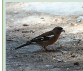
Fringilla coelebs -Σπίνος