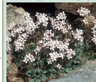
Arabis purpurea - Κλάματα της Παναγίας