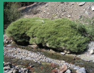
Genista fasselata var. crudelis -Ραιήν του Τροόδους