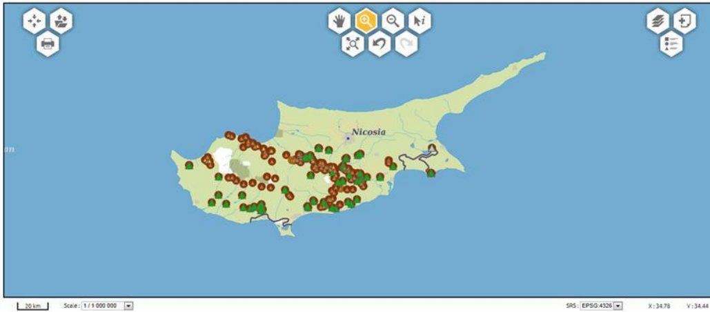
Χάρτης της Κύπρου από το δίκτυο με σημεία με ορυκτούς πόρους της Κύπρου