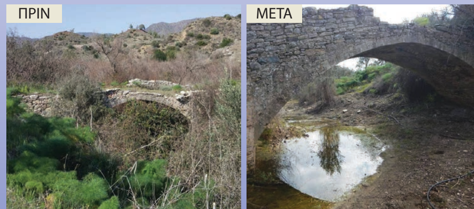
ΠΕΡΙΟΧΗ 1 πριν και μετά την εκτέλεση των έργων αφαίρεσης ξενικών ειδών – Ανάδειξη πολιτιστικών στοιχείων