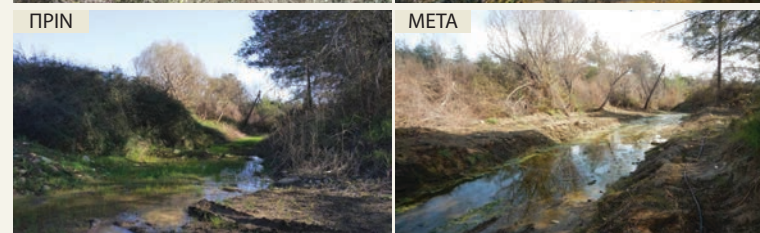
ΠΕΡΙΟΧΗ 3 πριν και μετά την εκτέλεση των έργων αφαίρεσης ξενικών ειδών, φύτευσης και τοποθέτησης του αρδευτικού συστήματος