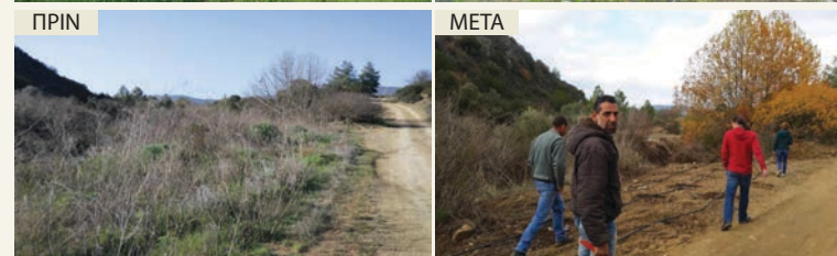
ΠΕΡΙΟΧΗ 3 πριν και μετά την εκτέλεση των έργων αφαίρεσης ξενικών ειδών, φύτευσης και τοποθέτησης του αρδευτικού συστήματος