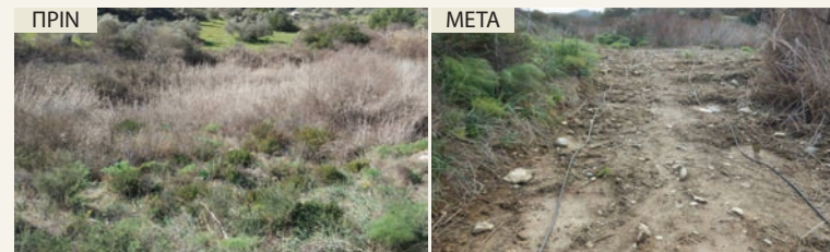
ΠΕΡΙΟΧΗ 1 πριν και μετά την εκτέλεση των έργων αφαίρεσης ξενικών ειδών, φύτευσης και τοποθέτησης του αρδευτικού συστήματος