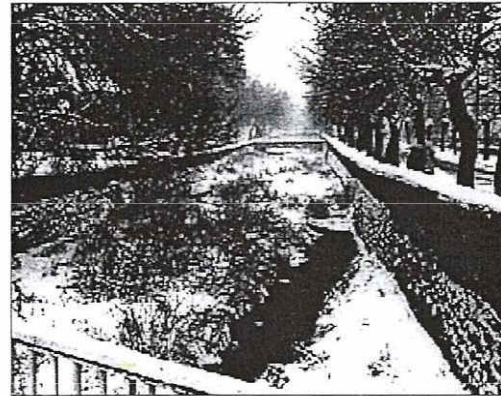
Ο ποταμός όμως όσο πάει και κατεβάζει, κατεβάζει εκατομμύρια τόνους νερό και ο βουιστός πια γίνεται μούγκρισμα πληγωμένου λιονταριού, που σπαράζει από τον πόνο του...

τού και της ορμής με την οποία κατεβαίνει ο Πηδκιός έχω προσωπικώς μιν ιδέα, γιατί μιν εποχή, που εκατοικούσα στους Αγίους Ομολογητές, είχα σπιτί, που η αυλή του ήταν ακριβώς στην όχθη του ποταμού και συνέβη δυο-τρεις φορές βλέποντας κατά το Αρμιστείον να δια τον ποταμό που εκατόφθανε "τουλουπιστός" και σκέπαζε απότομα με άγκον νερού την ξερή ως την στιγμή εκείνην κοίτη του. Αυτό με βοηθά φυσικά στην περιγραφή του μεγάλου κακού. μιν λίγο η κατάστασις γίνεται τραγική. Ο ποταμός δεν είναι πια ποταμός, αλλά "όλοσσα κυματισσοσα", "όλοσσα πλασιό"... Περνά πάνω από το γεφύρι, (το παλιό γεφύρι, όχι το σημερινό, με τα πολύ μεγαλύτερα τόξα, που έγινε μετά την Αγγλική Κατοχή) ξεπλώνει σε όλες τες διευθύνσεις και κυρίως ορμά εναντίον της Λευκωσίας, προς την οποίαν εύρισκαν διεξόδο τα νερά του, αφού το έδαφος προς τον σημερινόν Δημόσιον Κήπον παρουσιάζει σημαντική κλίση, αφού κατακλύζει σε λίγο δευτερόλεπτα όλην την έκτασιν από την Περβόλαν του Τσαυταίρη Ππασιά έως την Πάρταν τής Πάφου κάμνει "Λυσσώδη έφοδον" επάνω στο Κάστρο τής Λευκωσίας. Τότε μόλις είχαν αντιληφθεί καθαρά πια τον κίνδυνον οι Τοποσιδές τής Πόρτος τής Πάφου κι έτρεξαν να την κλείσουν καλά-καλά και να την αμπαρώσουν όσο μπορούσαν ασφαλέστερα.