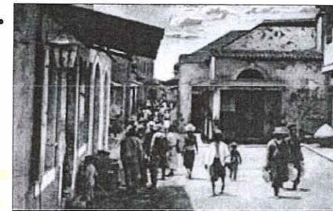
Το μεγάλο δυστύχημα είναι ότι η πλημμύρα έγινε μέρα κι έτσι τα μαχαζιά στην Αγοράν ήταν όλα ανοικτά κι ο κόσμος εκκυκλοφορούσε εδώ κι εκεί, ανύποπτος για την μεγάλη συμφορά.